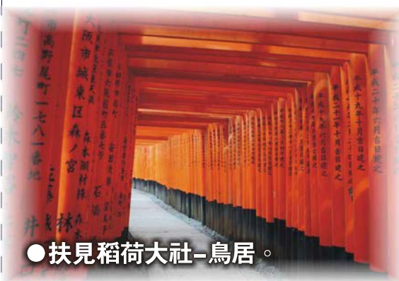
● 扶見稻荷大社-鳥居。