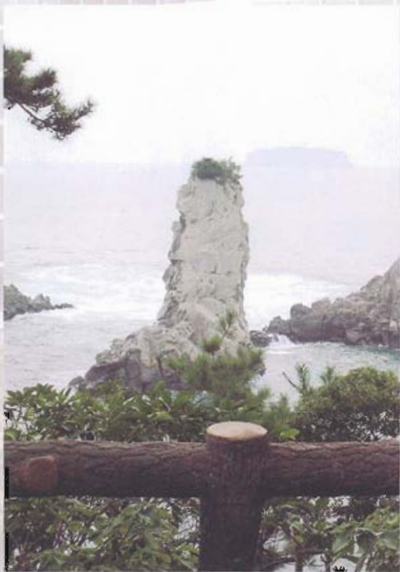
▲ 濟州島玄武岩柱開發成觀光景點。

委會提出申請，但礙於現行保育法令及環境影響評估，一直沒有下文，讓澎湖海豚王國名聲不再，更別提寄望觀光帶來的週邊利益，而海豚族群數量的增加，也造成漁民與其眼中「海賊」海豚間的衝突，常傳出海上虐殺及觸網死亡任意丟棄的案例，其實只要專業規劃，加上良好的環境照顧，海洋生物明星表演館的成立，不僅帶來觀光商機，同時也能給予下一代良好的保育觀念宣導，而非一再的法令禁止，就是正確的保育觀念，唯有妥善的管理，加上適度的宣導及保育法令雙管齊下，才能達到真正的效果。