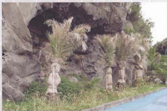
▲ 濟州島熱帶雨林植栽配合玄武岩美景，形成海洋島嶼特色。

，地理環境與澎湖六十四個島群組成相似，海岸線綿延二百五十三公里，觀光旅遊業佔全島收入的七成，成為澎湖縣觀光考察的主要方向，而濟州島上也設有觀光賭場，縣府團隊成員也在晚間閒暇之餘進入賭場「考察」，順便試試手氣，眾人集資下場，還各贏得一筆小財，為此行增添些許經費，大家都能滿載而歸，但民風較台灣更為保守的朝鮮民族，開放觀光賭場，同時嚴禁本國人進入，必須持國外觀光護照才得以一窺觀光賭場的全貌，由觀光著眼點進行賭場規劃，似乎也值得澎湖爭取觀光賭場方向考量，澎湖博弈事業籌組草案，也將澎湖縣民及軍公教人員排除，但未來實施的成效如何，仍有待時間證明。