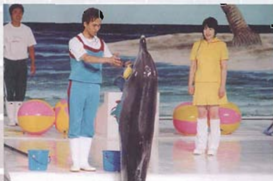
▲ 韓國濟州島海豚表演成功，帶動當地觀光發展。

如何效法韓國濟州島的國際自由城市、世界和平島及玄武岩地質公園，都是未來澎湖縣政推動的重點，另外，在國內民調名列前茅的賴峰偉，出國考察也在他鄉遇到不少台灣旅客，紛紛爭相合照，同時賴峰偉也應邀在聞名世界的盆栽藝術苑題字留念，成為台灣第一人，與中國國家主席江澤民墨寶並列，對於有意逐鹿南台灣港都百里侯的賴縣長而言，能見度及知名度的提升，有相當大的助益，也是成功的國民外交典範，突破台灣外交困境的最好明例。