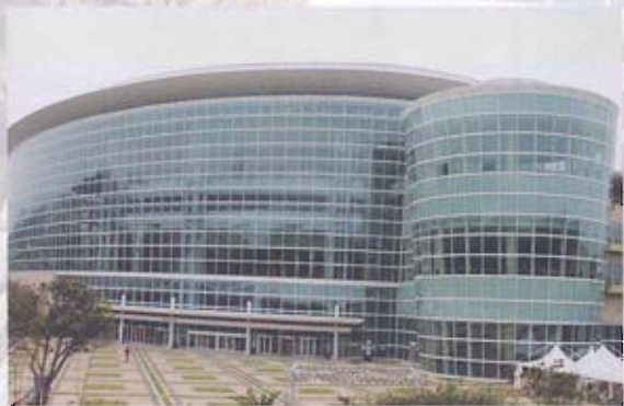
▲ 濟州島世貿館外型宏偉，成為世界精品展售中心。

濟州島人口數約五十五萬，面積一千八百四十七平方公里，周邊環繞六十三座島嶼，其中有人島八座、無人島五十五座