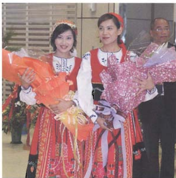
▲復興航空空服員身著葡萄牙傳統服裝代表澳門旅遊局歡迎澎湖旅客。

雖然馬公機場國際包機完成首航，但仍留下對向班機沒有來客的遺憾，由於東部花蓮機場、中部清泉崗機場都曾舉行國際包機首航，但日後都效果不彰，其中清