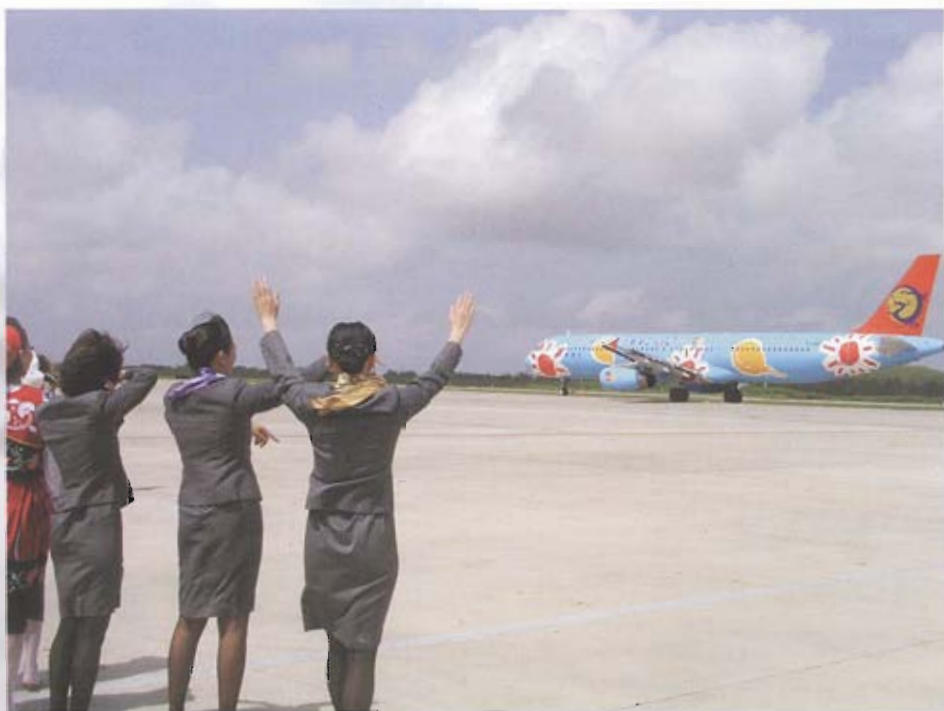
◀ 復興航空員工列隊歡送澎湖國際首航班機。

馬公機場已具備國際線的雛型，加上澎湖天然條件優越，開拓國際航線僅剩下宣導與加強軟硬體設施兩方面的努力，躍升國際舞台絕對不能像以往土法煉鋼，必須印製多國文字的宣導品，並派出親善大使前往世界各國宣導，甚至配合行政院觀光客倍增計畫，優惠票價提供國外遊客抵澎，進而愛上澎湖這塊美麗島嶼，至於軟硬體設施，則應加強澎湖民衆英語能力，能與國際溝通橋樑接軌，最主要不要存有坑殺遊客的心理，才能永續經營澎湖國際觀光事業，至於現行水電、住宿等基礎設施，則有待加強，如何吸引國外投資五星級飯店進駐、增建大型購物市場及室內遊樂場，都是未來政商各界必須努力的課題，才能使澎湖真正達到國際島嶼、海上明珠的境界。