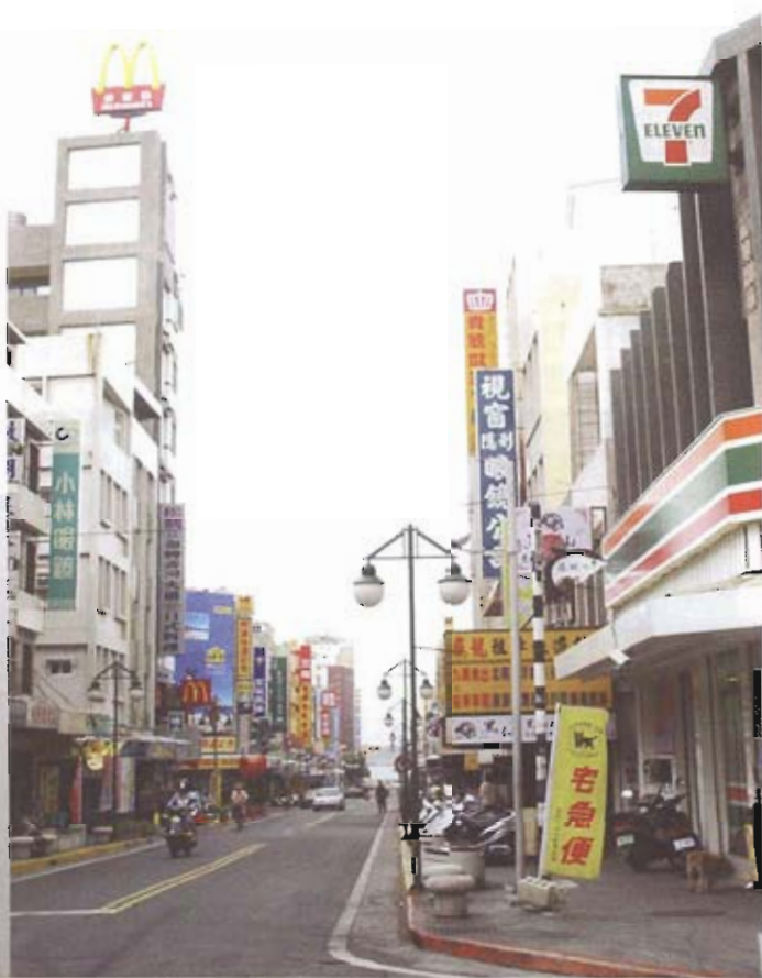
▲ 統一超商、麥當勞等連鎖店進駐，直接衝擊了傳統的商店。

在遠洋有大型漁船駛往外國海域作業，為國家賺取了不少外匯。又有珊瑚漁船在中途島作業，漁獲