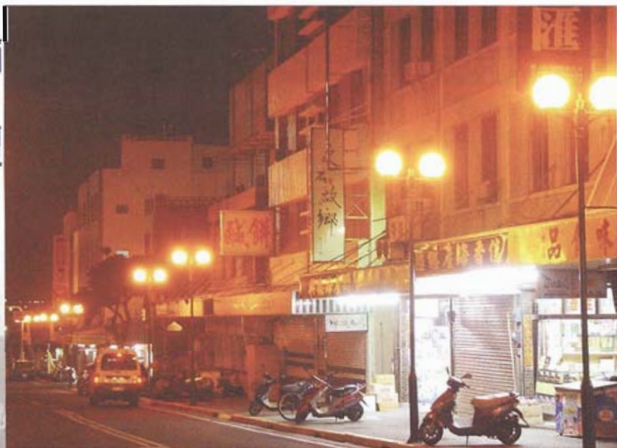
▲ 華航空難、SARS嚴重打擊澎湖觀光，著名的中正路商圈也不見遊客。

家，從床鋪底下就湧出石油，所以它的國民富可抵國」，而澎湖人的床鋪底下是汪洋大海，海洋的資源是「取之不盡，用之不竭」。我們要用大海改造澎湖的命運。現在是知識經濟時代，政府已加入WTO，澎湖的漁業受到衝擊，漁業的產量逐年遞減，已到了零成長的困境，再加