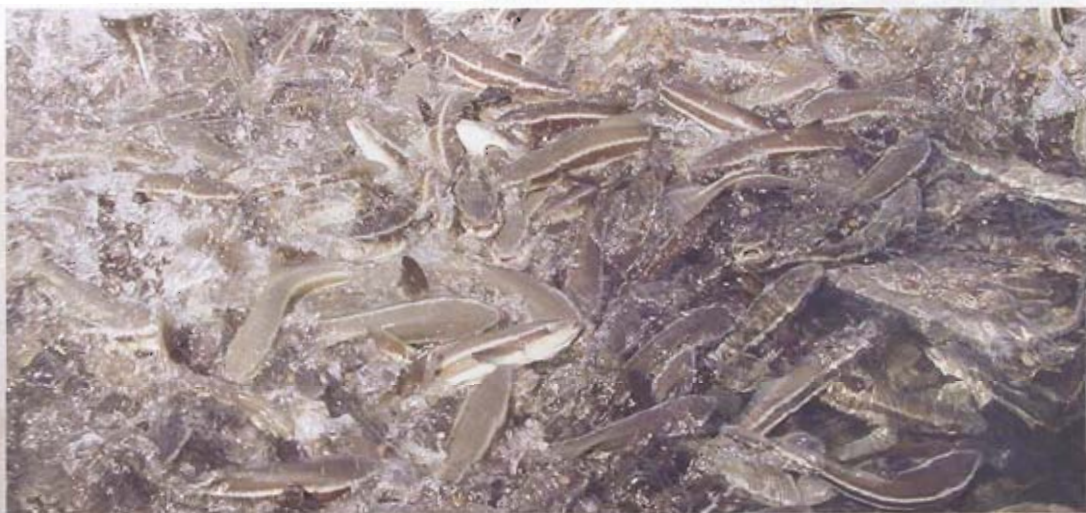
▲ 澎湖縣最著名的養殖海產海鱸，萬魚爭食，場面刺激。

澎湖得天獨厚，四面環海，大海是我們生存的憑藉。我們要感謝大海「物盡其用」，如果把澎湖海域變成高經濟價值養殖漁業的寶藏，把澎湖變成養殖黑珍珠、海鱸、九孔的海島，這豈不是從根本改變了澎湖人貧窮落後的命運？否則，只是坐而說不能起而行，那豈又不是暴殄天物，辜負了上蒼給澎湖最寶貴的大海，而抱著金飯碗哭喊窮？