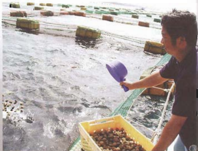
▲ 箱網養殖是目前澎湖發展漁業的重點。

二、箱網養殖海鱸漁業。 澎湖箱網養殖雖然歷史很久，但在資金及技術多重困難下，都靠業者自己憑經驗默默地摸索。其中最先養殖的牡蠣、石斑魚、嘉鱸魚等，最具規模又頗有成就的就是湖西永安橋海域的養殖場，養殖高級魚類行銷國內外。而在西嶼、菜園的海鱸養殖場目前成為最熱門，被稱為澎湖明日之星。海鱸成長迅速、肉質肥厚，魚背、腹、頭都有利用價值，更含有豐富的DHA、EPA及牛