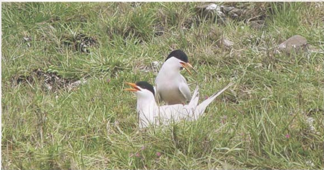
▲ 澎湖每年四至九月為燕鷗繁殖季節，在玄武岩保育區雞善嶼，燕鷗自在的繁衍。

據調查統計，貓嶼計發現二十八科、七十五種鳥類，其中燕鷗數量最多，又以白眉燕鷗、玄燕鷗佔最大宗，而自然玄武岩保育區的錠鉤、雞善、小白沙嶼，每年四至九月是燕鷗繁殖的季節，除了白眉燕鷗、玄燕鷗之外，還有紅燕鷗、蒼燕鷗及鳳頭燕鷗，鳥種的多樣化及數量眾多，都是澎湖擁有的珍貴自然資源。