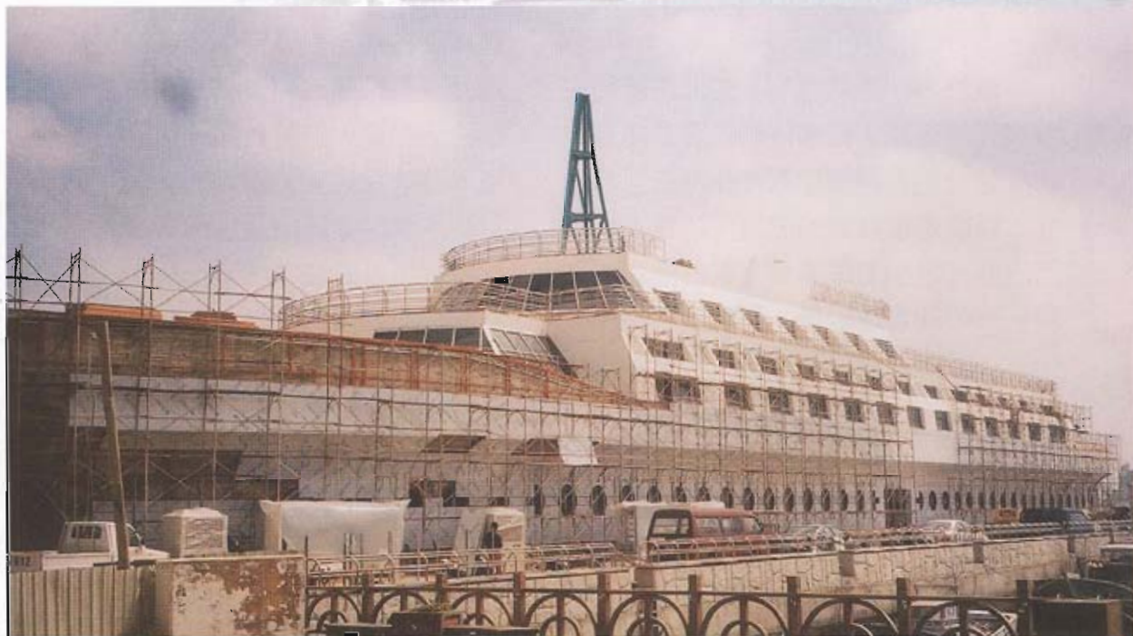
▲「船屋」、「漁人碼頭」是澎湖最新的景點，兼俱遊憩與購物之多重功能，是島國地區頗富特色之建設，未來開發完成，值得期待。

如果，澎湖以「自然生態保護區」的觀光據點吸引力來規劃開發，那麼順著自然設計的文化及生態之重建，