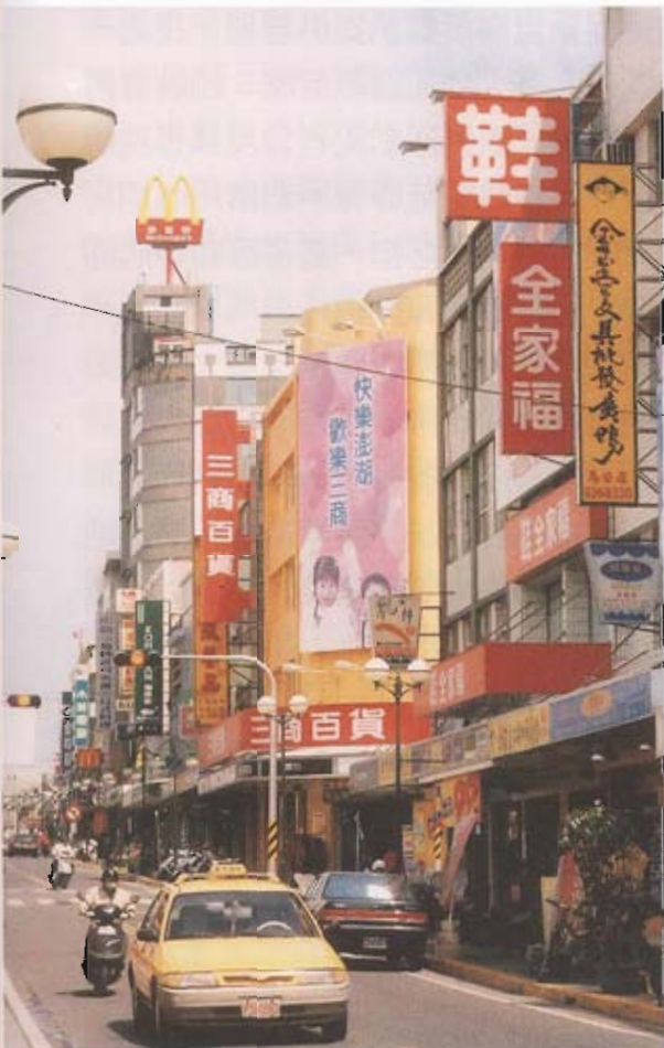
▲中正路商家雲集，各國各大連鎖店如麥當勞、三商百貨、全家福、統一超商、小林眼鏡、珈琲館等，已漸有全國名街之規格。

方政府及觀光組織在主要旅遊門戶、車站、廣場等節點，結合民間觀光業者建置旅遊服務中心（站），提供旅遊資料及諮詢服務；並以觀光局目前建置之觀光入口網站為基礎，整合旅館、旅行、遊樂區業者及公部門風景區管理單位、地方政府觀光推廣單位、民間旅遊機構等建構完整之旅遊