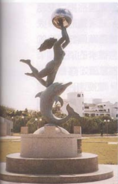
▲「海上明珠」之公共藝品，設立於觀音亭運動園區內，由旅高名畫家許一男先生創作，有海洋、海景之意象。

觀光向前衝，首重促銷宣傳及資訊提供管道，在這一部分，公部門是循多管道進行，參加國際旅展、印製宣傳摺頁和小冊、觀光網路設置、觀光活動記者會及業者說明會、遊客服務中心的設立、媒體接待等等，非常用心地利用有限的預算去創造無限的可能。可惜，遊客服務中心的使用價值只限於旅遊諮詢及觀光資訊的提供。