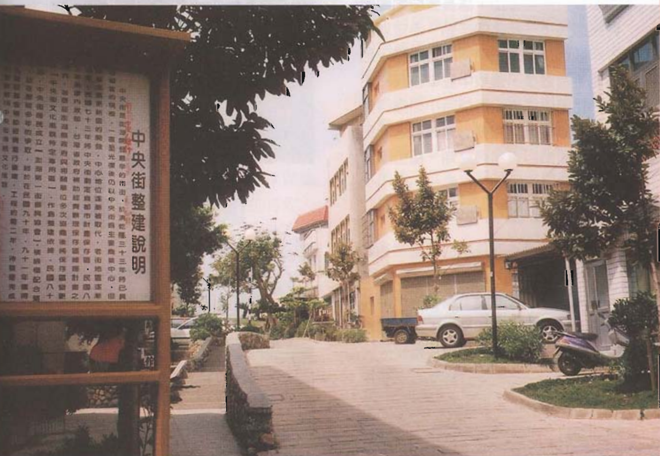
▲中央街整建完成，有歐洲林蔭巷道之架勢，岩石步道、花台、矮牆，是遊客駐足之地。

會只有一次。當全球化辯證的是地方經濟發展利益，台灣將以「顧客導向」之思維、「套裝旅遊」之架構、「目標管理」之手段，選擇重點拓展觀光，澎湖能否搭上這班旅遊建設列車，躍上國際舞台，端賴公私共識即早形成，充分展現海島漁村風情。