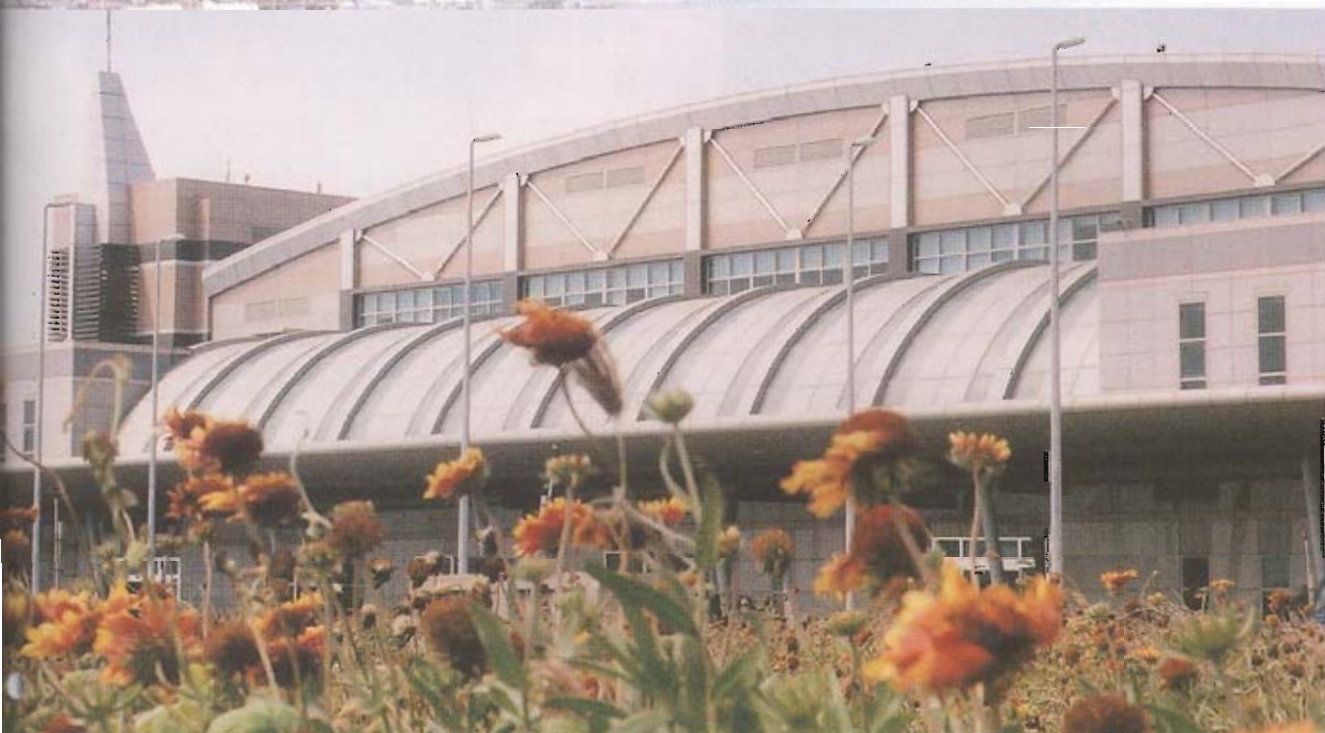
▲新建完成，落成啓用之澎湖馬公機場航站大廈，有國際級的水準，大廈前之天人菊滿地，迎風搖曳，代表澎湖之縣花，歡迎各地遊客。

在行政院核定之觀光客倍增計畫內，旅遊資訊服務網一項，計畫將仿效歐洲、日本等先進國家，輔導推動各地