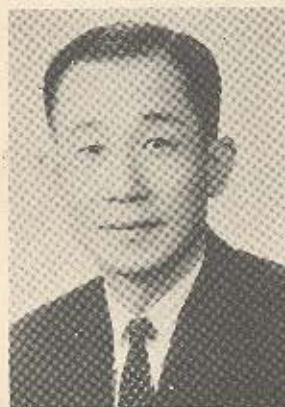
搖扶任主組事議許