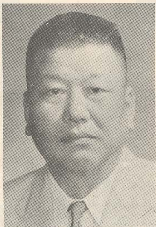
鄭 議 長 大 洽