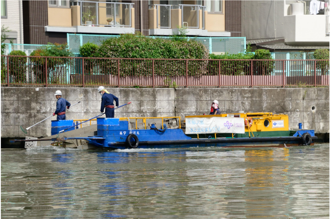
清理河域工作人員