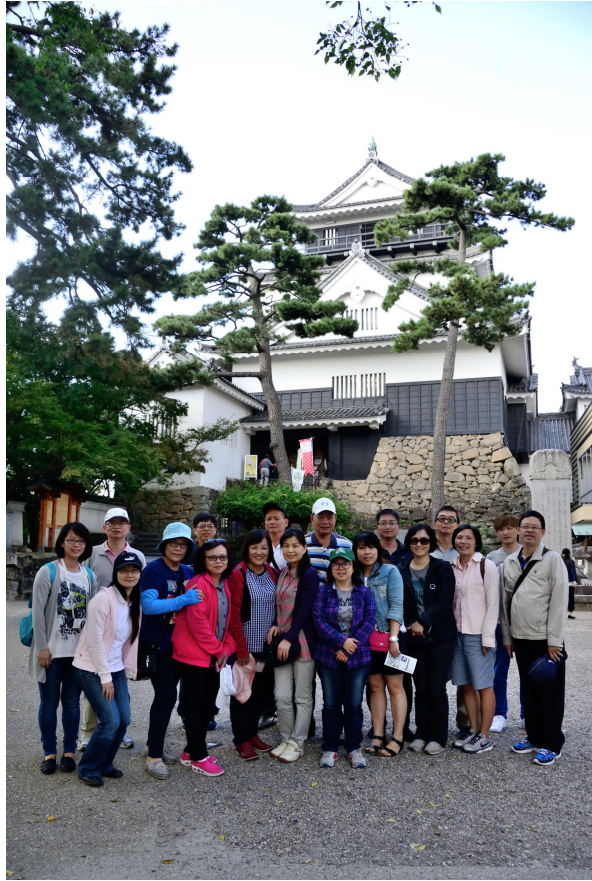
團員於岡崎城前合影