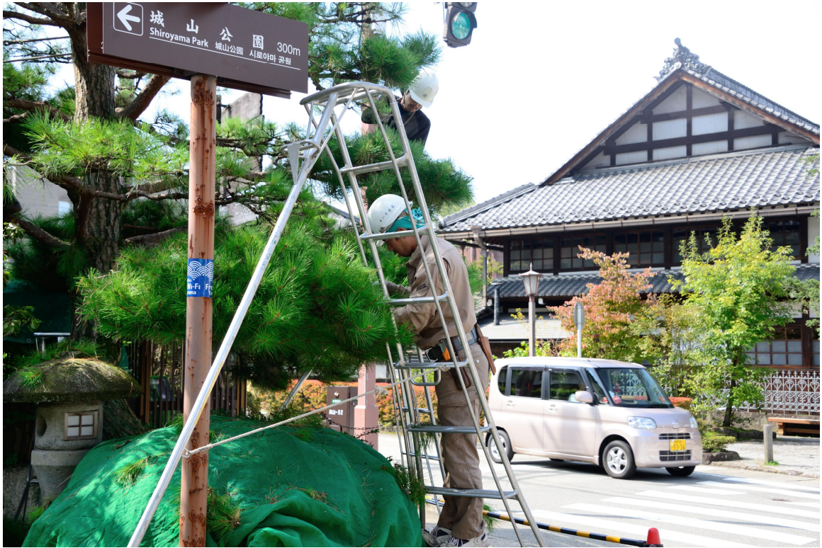
高山三之町修剪樹木工作人員