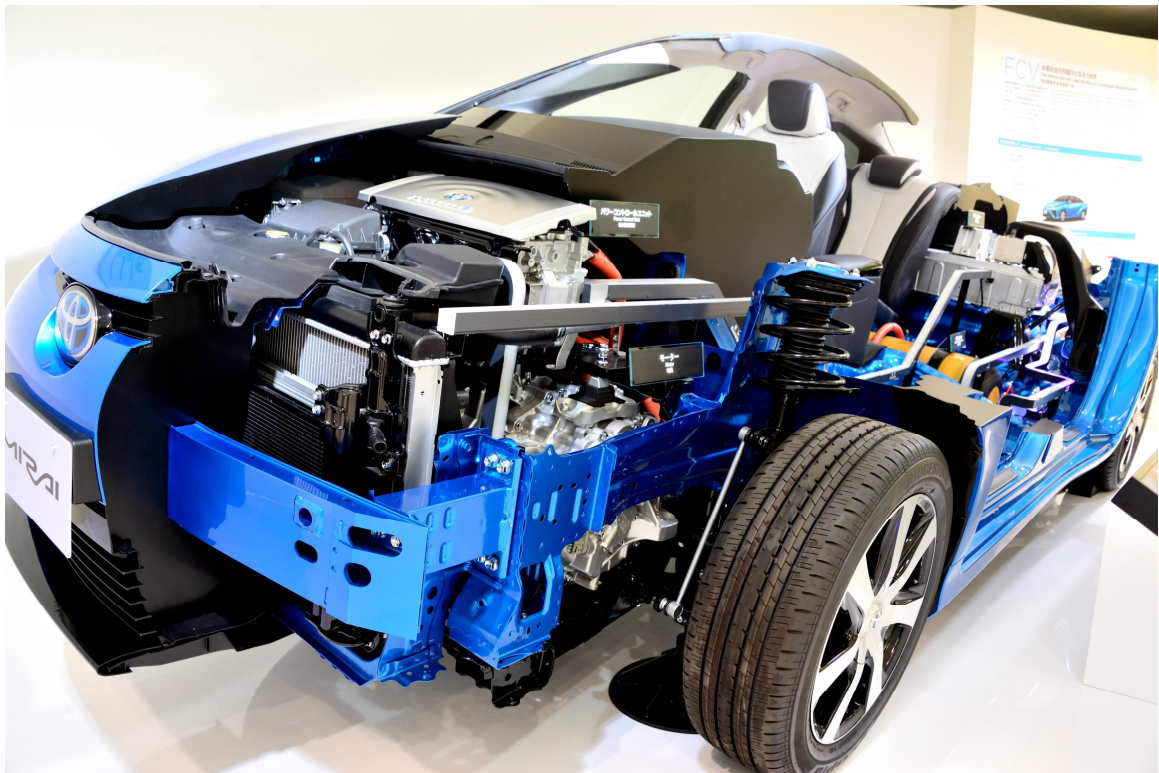
豐田汽車產業館展示車