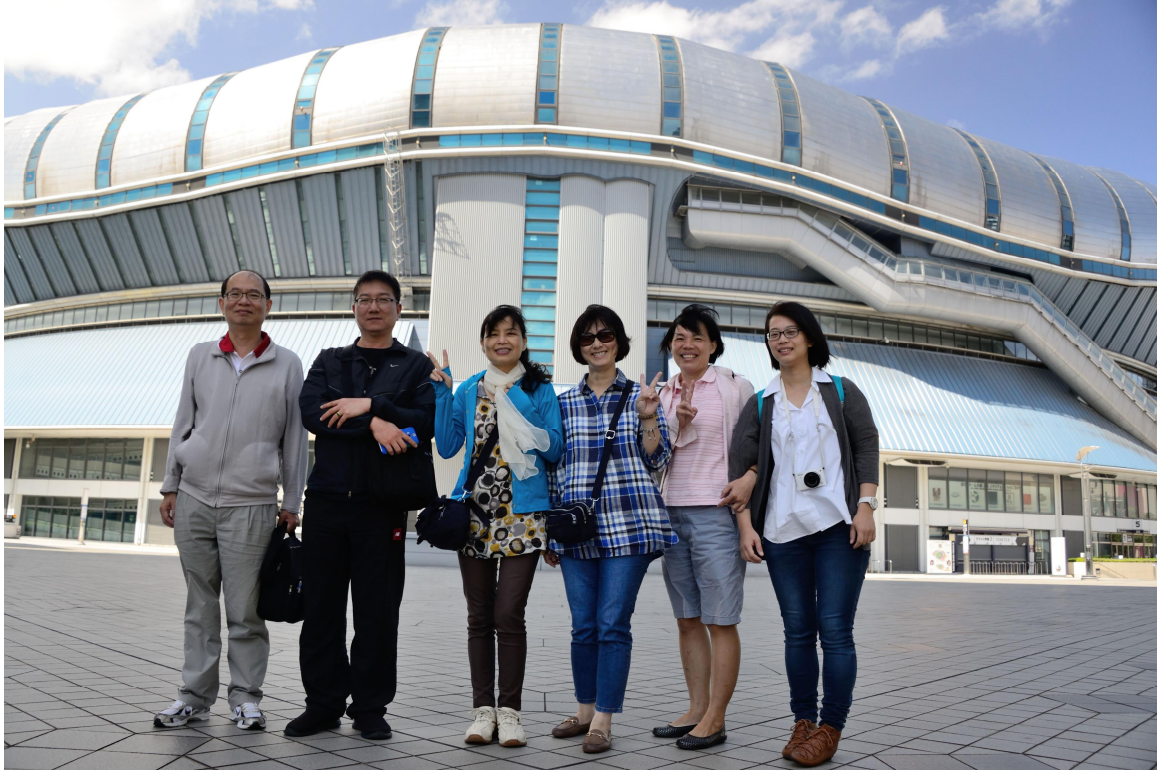
於京瓷巨蛋前合影