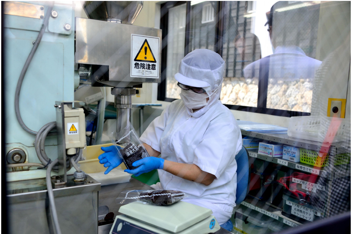
八丁味増工作人員進行填充包裝