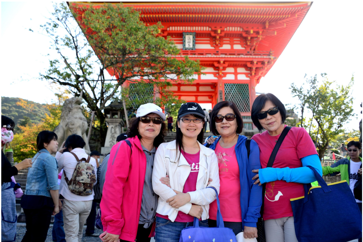
團員於京都清水寺合影