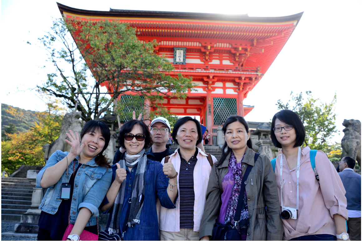
團員於京都清水寺合影