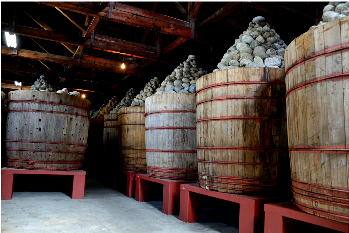
八丁味増製造儲存區